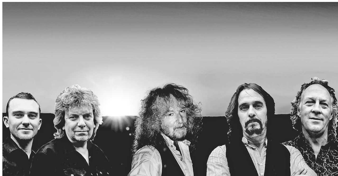
Rocklegende. «Barclay James Harvest feat. Les Holroyd» bringt orchestralen Rock in die Briger Simplonhalle.